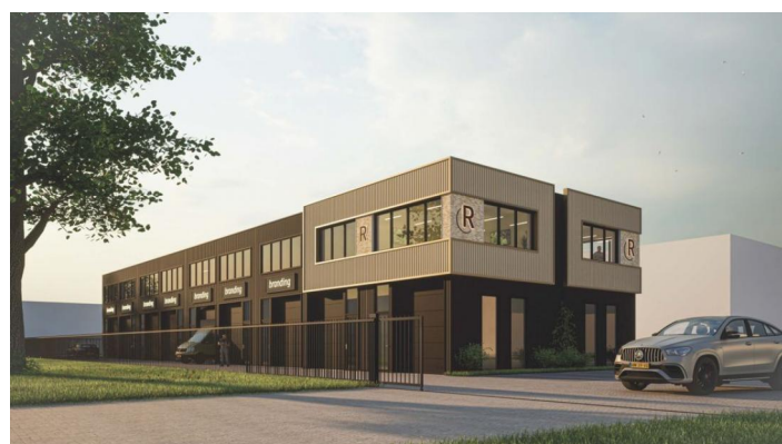
Artist impression zicht bij inrijden terrein