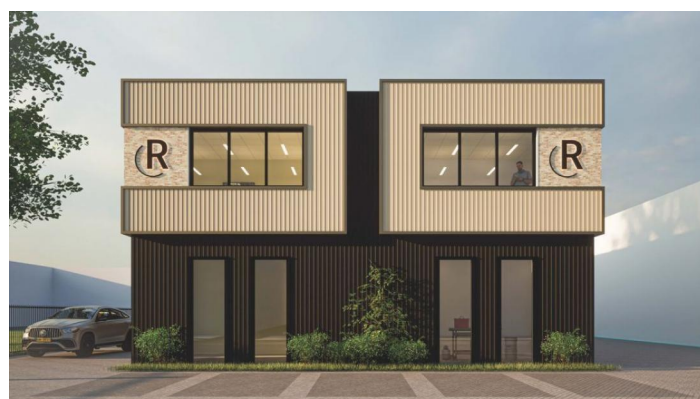
Artist impression Voorgevel